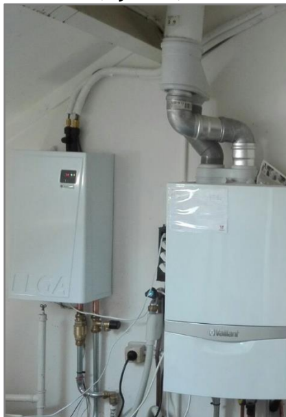
Techneco Elga (Hybride)