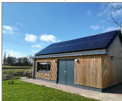
Zonnepanelen Schuin / Plat