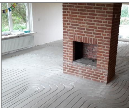
Vloerverwarming Infrezen / Draadstaal