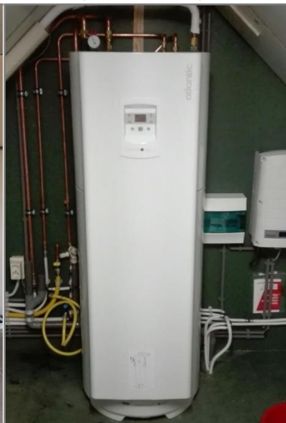
Techneco Loria duo (Stand alone)