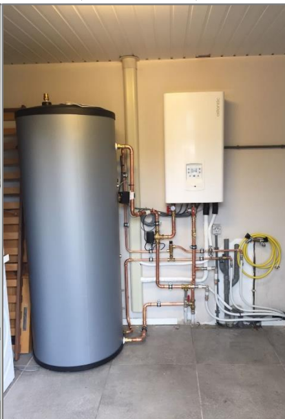
Techneco Loria Single (Stand alone)